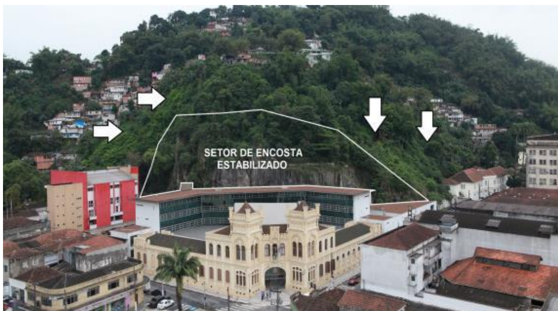
Imagem aérea da Câmara