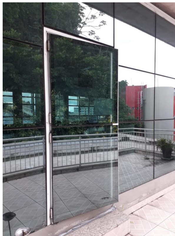
Foto da Vista exterior da porta