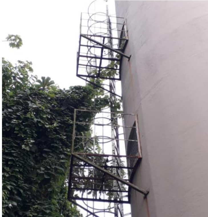
Foto das plataformas existentes