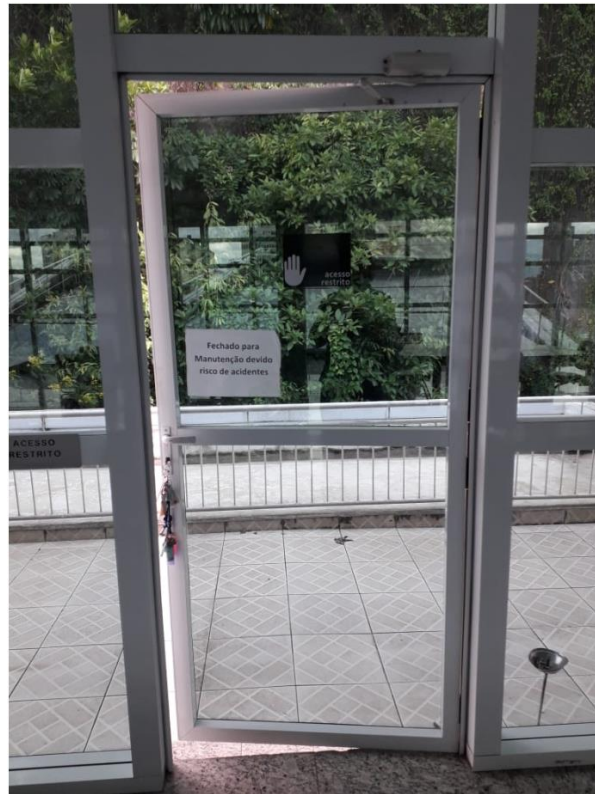
Foto da vista interior da porta